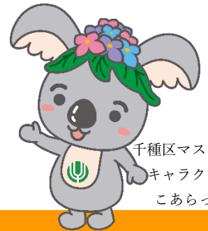
千種区マスコット キャラクター こあらっち