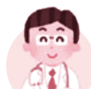
認知症サポート医